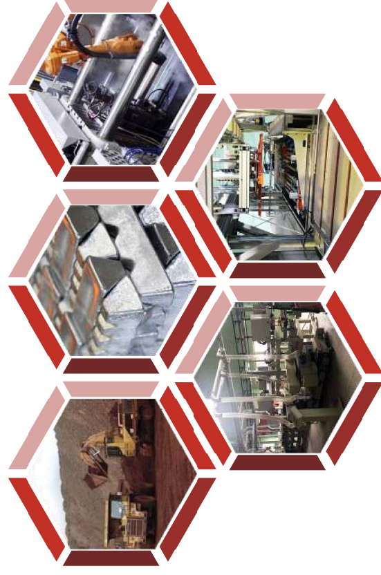
Механическая обработка на автоматизированных линиях S.A.I.P. (Италия)