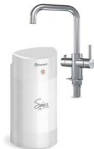
Мультипот система кипячения питьевой воды